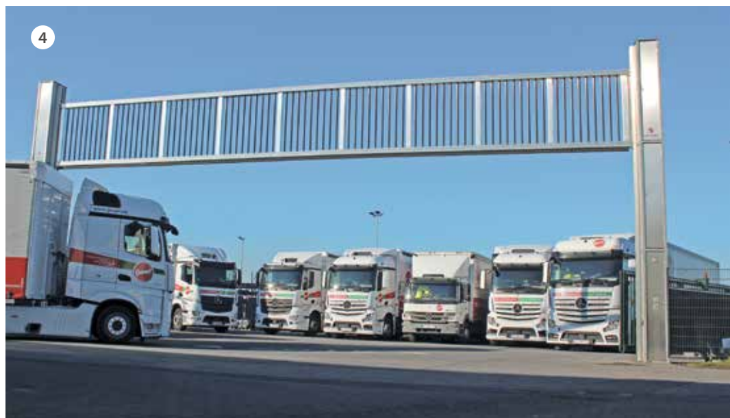
Bilder: 1. Montage Heuraupe 2. Messe Equitana; 3. Automatische Abkantpresse; 4. Fuhrpark mit Liftgate