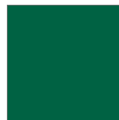
RAL 6005 Moosgrün