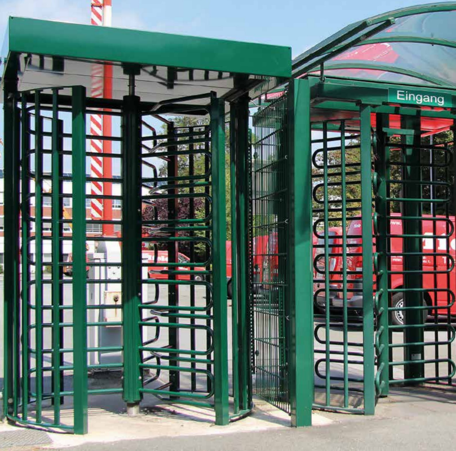
Elektrische Mehrfach-Drehkreuzanlage, grün pulverbeschichtet