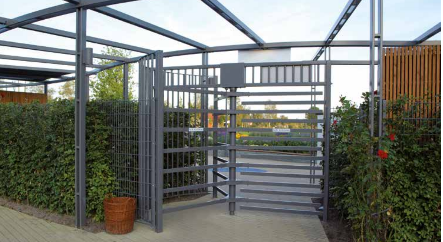
Manuelle Drehkreuzanlage, anthrazit pulverbeschichtet