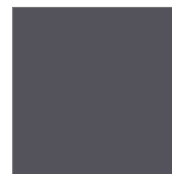
RAL 7016 Anthrazit