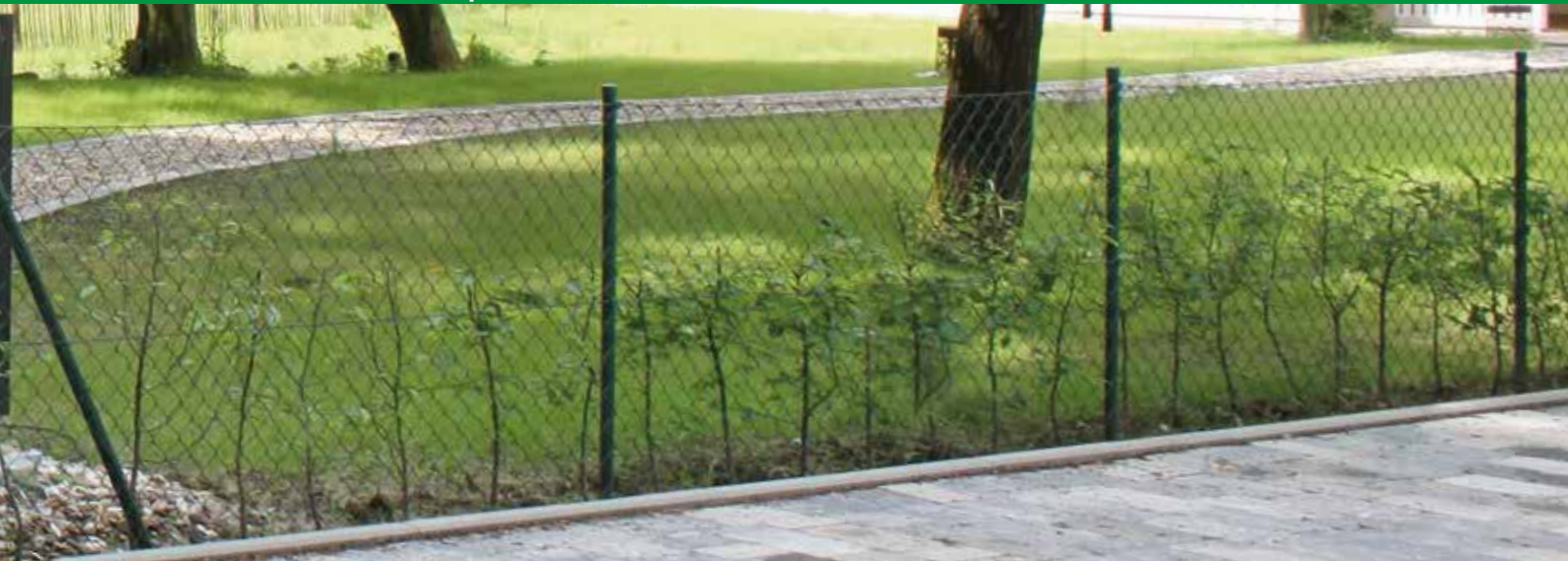
Maschendrahtzaun mit Rohrpfählen, grün beschichtet