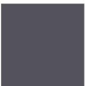
RAL 7016 Anthrazit