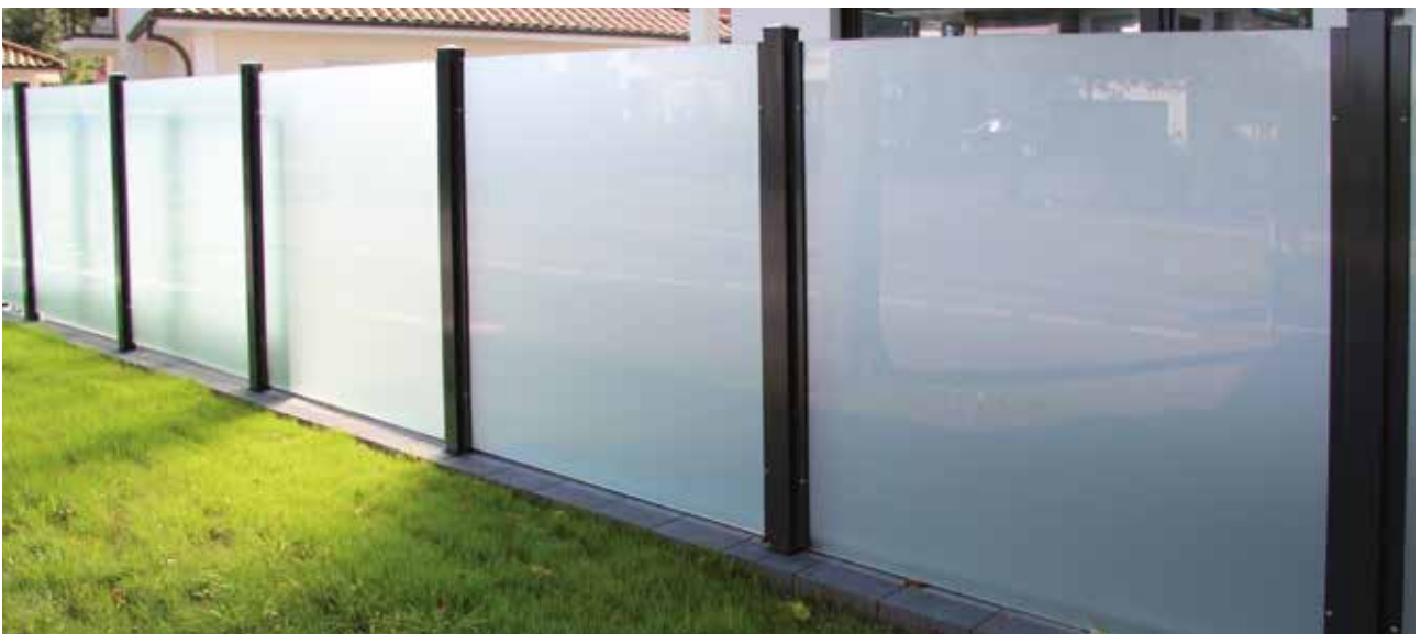
Klarglas ESG 8 mm, satiniert, mit Quadratrohrpfosten und durchgehender Glasleiste anthrazit pulverbeschichtet