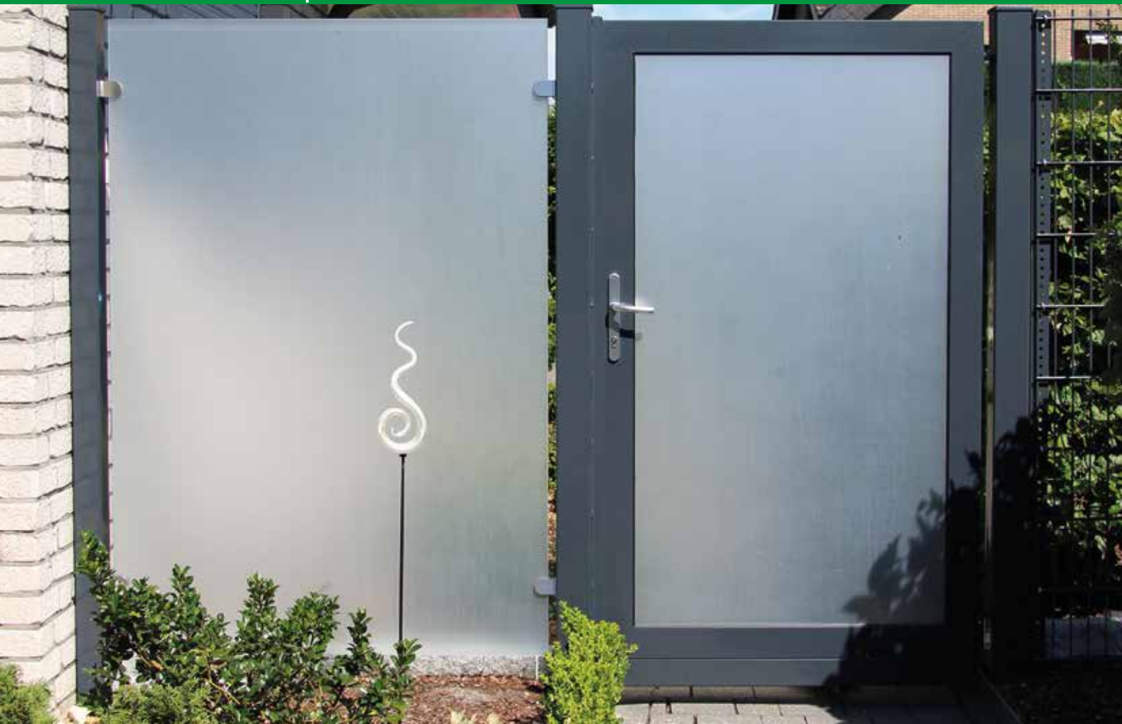
Klarglas ESG 8 mm, satiniert, mit Quadratrohrpfosten und Glashaltern, anthrazit pulverbeschichtet