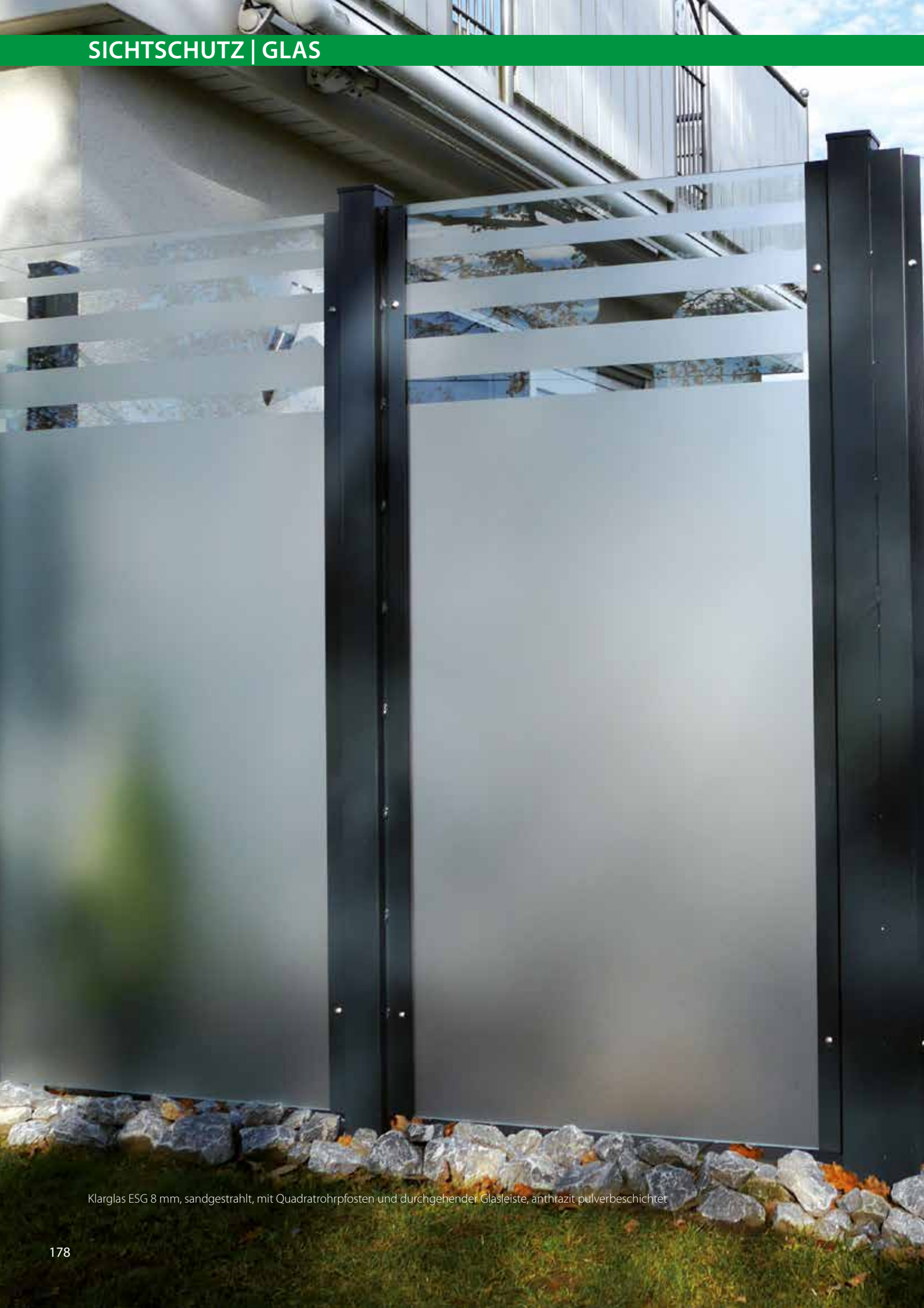
Klarglas ESG 8 mm, sandgestrahlt, mit Quadratrohrpfosten und durchgehender Glasleiste, anthrazit pulverbeschichtet