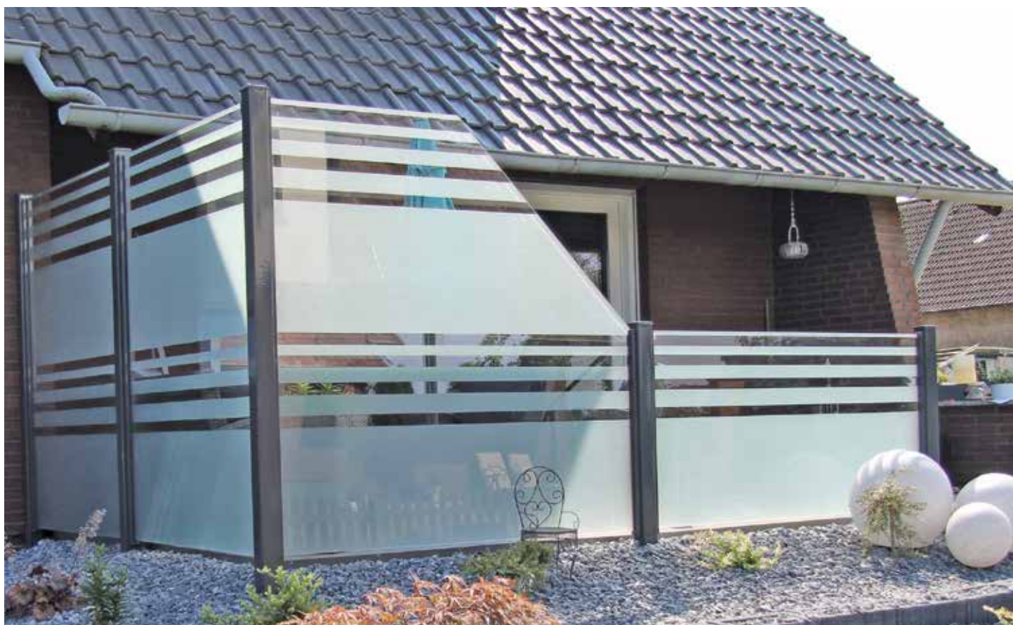
Klarglas ESG 8 mm, sandgestrahlt mit Quadratrohrpfosten und durchgehender Glasleiste, anthrazit pulverbeschichtet