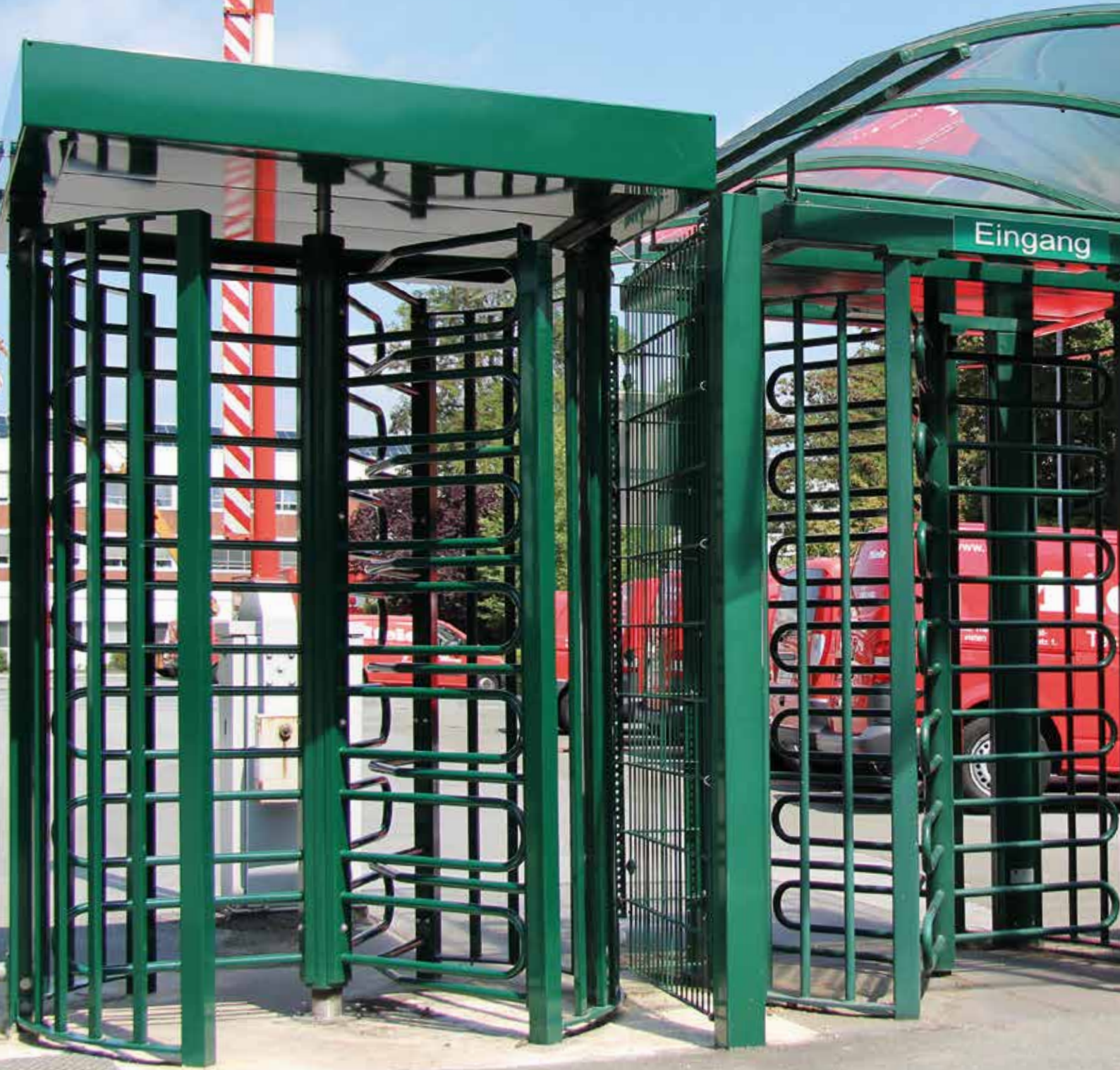
Elektrische Mehrfach-Drehkreuzanlage, grün pulverbeschichtet