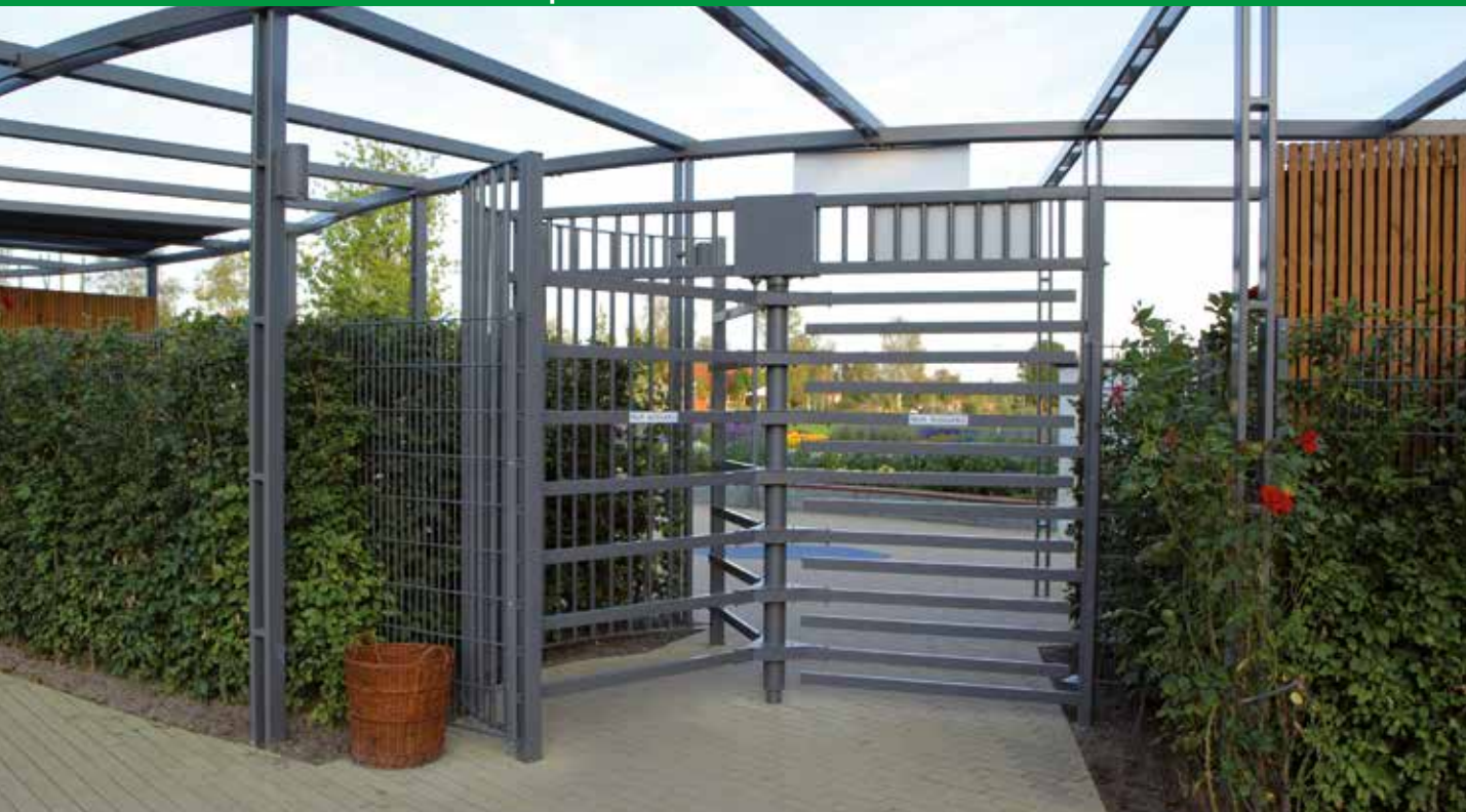
Manuelle Drehkreuzanlage, anthrazit pulverbeschichtet