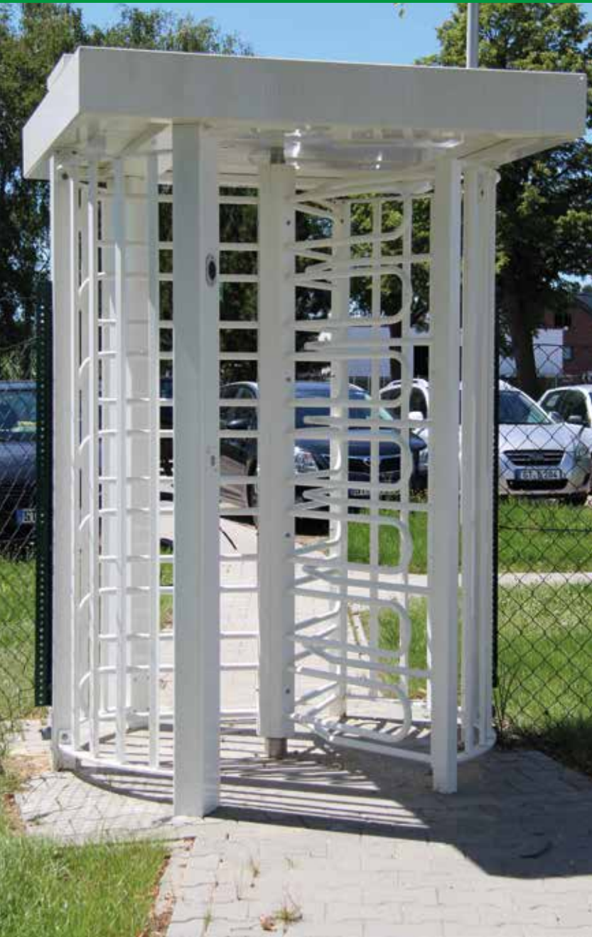
Elektrische Drehkreuzanlage, weiß pulverbeschichtet