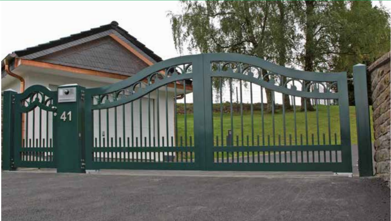
Modell Taunus, 1-flügeliges Personentor mit 2-flügeligem Drehtor, moosgrün pulverbeschichtet