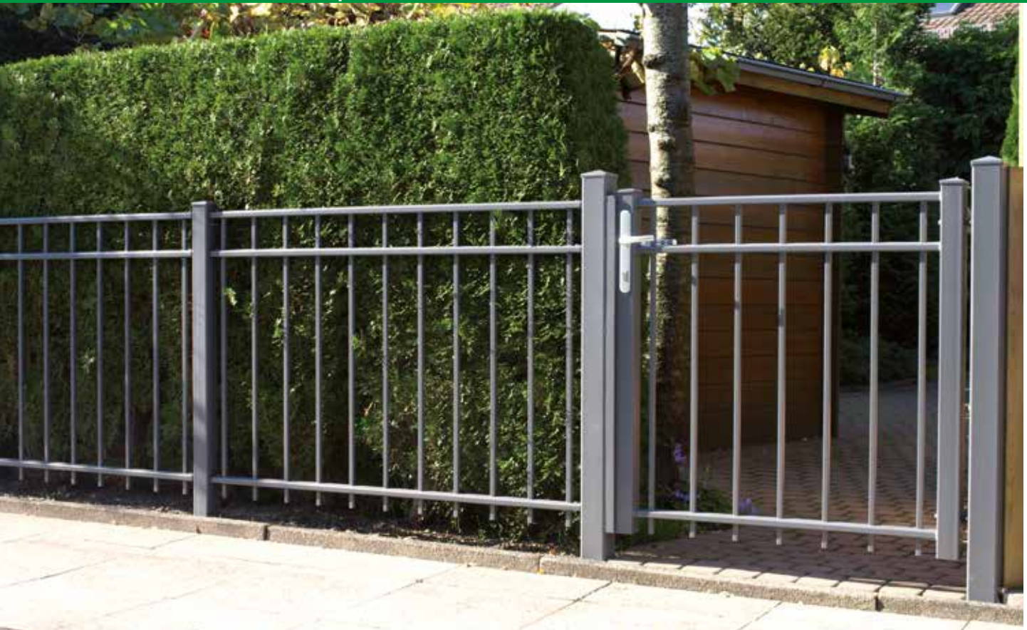
Modell Sofia, 1-flügeliges Drehtor, DB 702 pulverbeschichtet