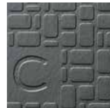
Mosaikdesign mit Deckschicht