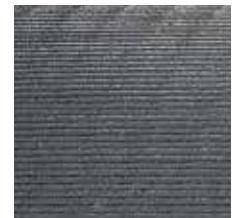
stabiles Rillenprofil an der Unterseite

* befahrbar mit üblichem Gerät, wie z.B. Hoflader oder Traktor, mit zugelassener Luftbereifung bei vorgeschriebenem Luftdruck bis max. 4 bar. (Beachten: mit notwendiger Umsicht fahren und in großen Radien lenken!)