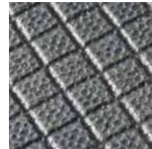
Rautenprofil mit Deckschicht