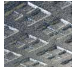
Multisquare-Profil an der Unterseite

* befahrbar mit üblichem Gerät, wie z.B. Hoflader oder Traktor, mit zugelassener Luftbereifung bei vorgeschriebenem Luftdruck bis max. 4 bar. (Beachten: mit notwendiger Umsicht fahren und in großen Radien lenken!)