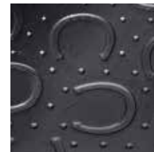
Hufeisenprofil mit Deckschicht